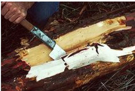
Extraction de l'Ecorce de l'If